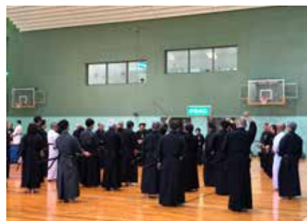
写真は徳島県剣道連盟の許可のもと撮影及び掲載しております